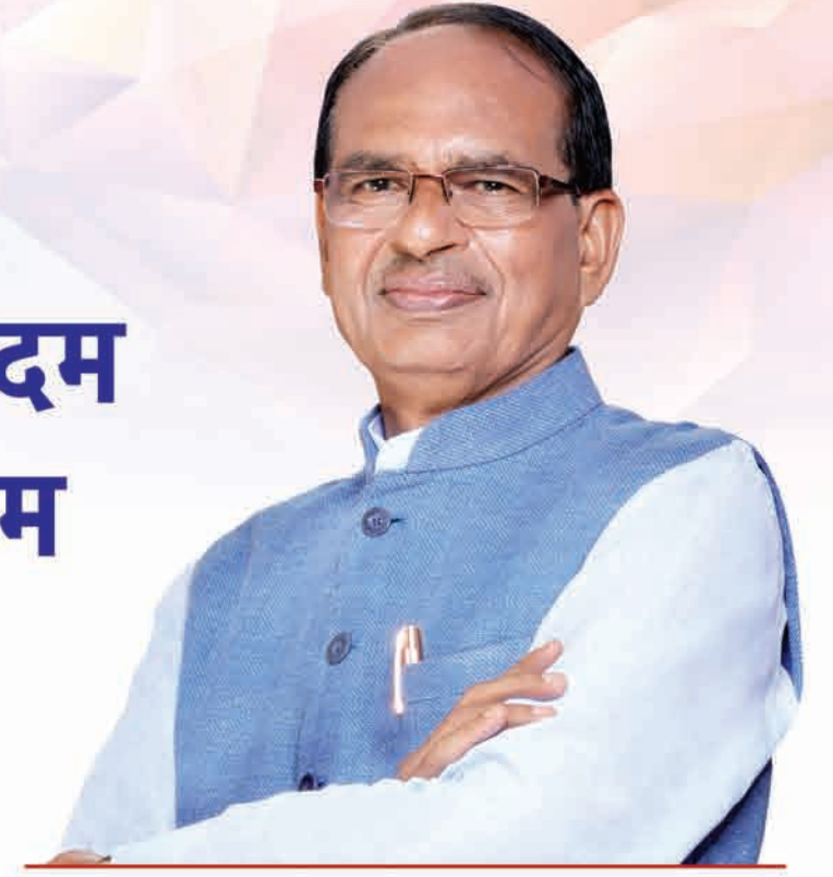
शिवराज सिंह चौहान, मुख्यमंत्री