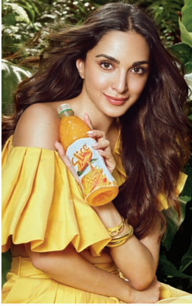
सेलिब्रिटी की सबसे ज्यादा पसंद की जाने वाली शादी की तस्वीर बताया गया। फिल्म की शूटिंग और बैंक-टू-बैंक ब्रांड घोषणाओं से भरे

जीएनएस। बॉलीवुड की गोल्डन गर्ल कियारा अडवाणी एक ऐसी सुपरस्टार हैं जो अपने सुपरस्टारडम के उदय के साथ सभी सही बॉक्स को टिक कर रही हैं। सफल फिल्मों की लगातार लिस्ट से लेकर इंटरनेट पर लोकप्रियता के चरम पर पहुंचने और ब्रांडों की एक लंबी सूची पर हस्ताक्षर करने तक, सुनहरे सपनों वाली यह लड़की कोई कसर नहीं छोड़ रही है। बढ़ते सुपरस्टारडम में जोड़ते हुए, अभिनेता को स्लाइस के नए चेहरे के रूप में शामिल किया गया है, जो एक प्रतिष्ठित ब्रांड है जो पूरे देश में अपनी व्यापक लोकप्रियता के लिए जनता के साथ सरहाया जाता है। ब्रांड के लिए नए लॉन्च किए गए टीवीसी में खूबसूरती और नज़ाकत के अपने परसलन टच को लाते हुए, कियारा अडवाणी विज्ञापन में हॉट और ब्यूट का एक सही मिश्रण पेश करते हुए हर तरह से मोहक दिखती हैं। हर कदम के साथ ऊपर की ओर बढ़ते हुए, कियारा अडवाणी ने सिद्धार्थ महेश्वर के साथ अपनी शादी के तुरंत बाद काम में गहराई से प्रवेश कर लिया है। सोशल मीडिया पर उनकी शादी की पोस्ट को भारत में किसी भी