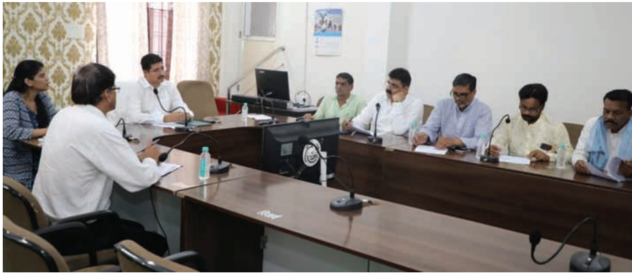
दावे आपत्ति सम्मिलित किए जाने के तरीके